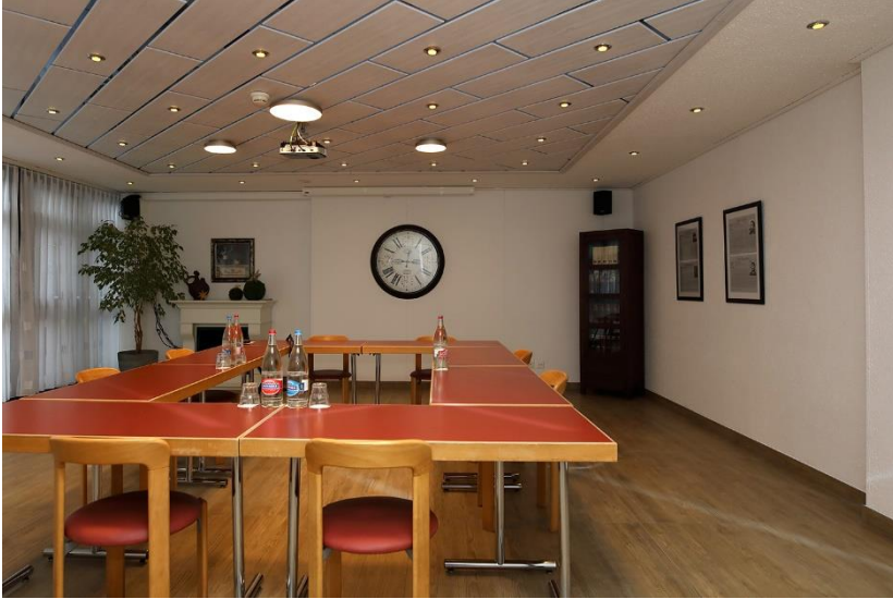
Seminarsaal Las Vegas